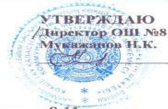
График проведения суммативных оцениваний за 1-четверть по предметам в 8-11 классах с 15 по 21 сентября 2024 – 2025 учебного года 1-смена