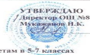
График проведения суммативных оцениваний за 1-четверть по предметам в 5-7 классах с 15 по 21 сентября 2024 – 2025 учебного года 2-смена